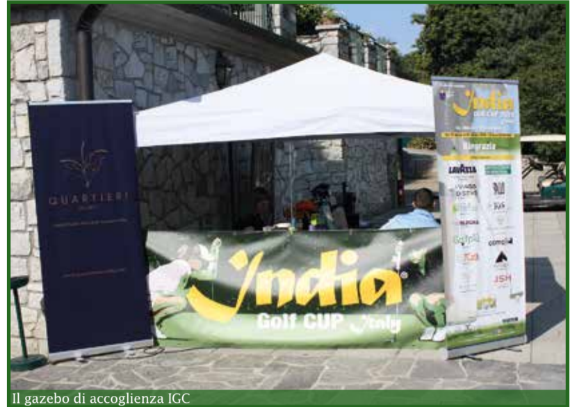
Il gazebo di accoglienza IGC