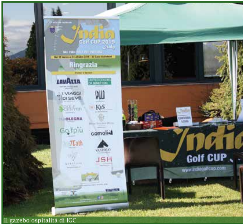
Il gazebo ospitalità di IGC

a chiudere con 37 punti Fabio Cannavale del Monticello.