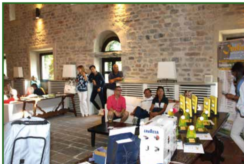
Una delle sale perfettamente restaurata ideale per il momento della premiazione

Nelle fotografie sotto alcuni premiati alla gara IGC del 18-08-2019 al Golf Club Varese