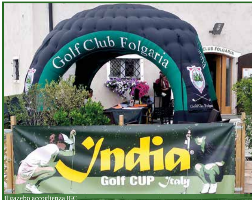
Il gazebo accoglienza IGC