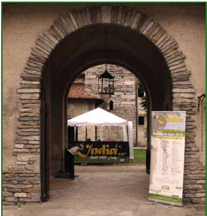
L'antico ingresso del convento ora porta d'accesso alla corte della Club House del Golf

Qualcuno direbbe: "finalmente splende il sole" ma ne è valsa comunque la pena aspettare quasi tre mesi per rigiocare una gara sospesa a metà per un forte e improvviso temporale estivo. A noi di IGC ci sarebbe dispiaciuto particolarmente non riuscire a far giocare ai nostri ospiti e amici un'intera gara del nostro Circuito qui al "Varese". Per gli amanti d'arte e di estetica una location bellissima e pervasa di storia e per gli amanti del golf di altissimo livello un percorso impegnativo ma che si snoda su un terreno di gioco tenuto in perfette condizioni, dove giocare po essere solo un piacere.