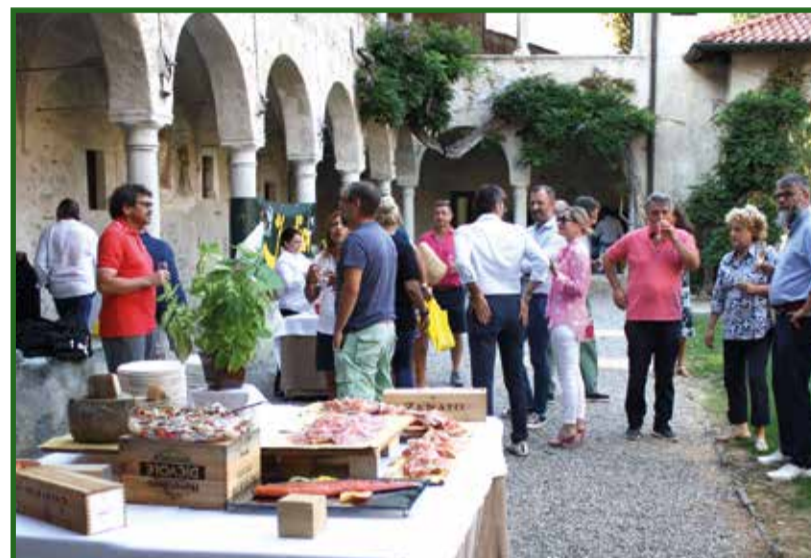
Il rinfresco all'interno della corte dopo le fatiche della gara