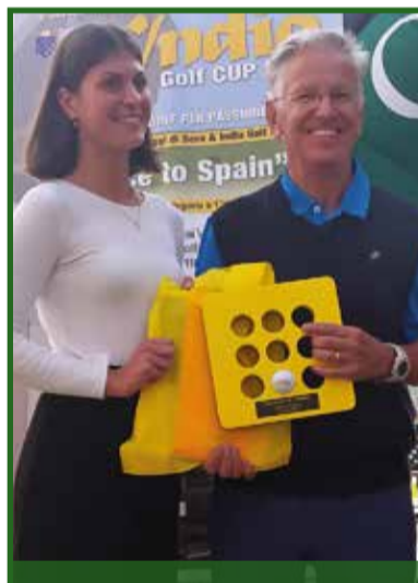
Nelle fotografie sotto alcuni premiati alla gara IGC del 10-08-2019 al Golf Club Folgaria