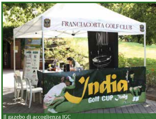
Il gazebo di accoglienza IGC