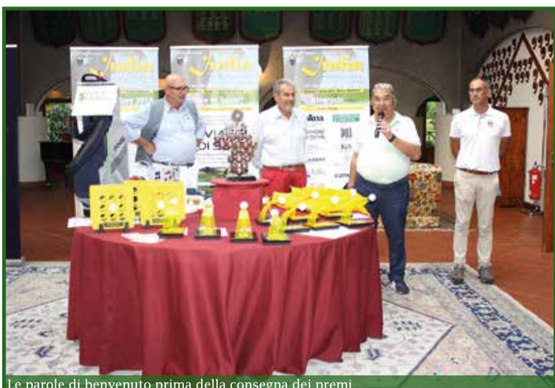
Le parole di benvenuto prima della consegna dei premi